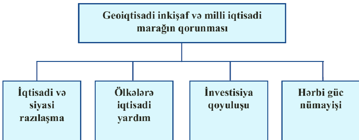
Şəkil 1.1. Geoiqtisadi inkişaf və milli iqtisadi marağın qorunması 1

Dunyada yeni geoiqtisadi mərkəzlərin kombinasiyası və muasir geoiqtisadi vəziyyəti səciyyələndirən “Ekonomist” jurnalı hesab edir ki, hazırda dünya dövlətlərindən bir kvartet yaranmışdır. “Guclu Amerika, inkişaf edən Cin, mubarizə aparan Rusiya, movqeyi muəyyənləşdirilmiş Avropa boyuk dövlətlərin yeni kvartetini təşkil edirlər”. Gələcəkdə bunlara Yaponiyada və musəlman dunyasında yarana biləcək iqtisadi guc mərkəzi birləşə bilər. Hesab edilir ki, guclu dövlətlərə Türkiyə, Braziliya və Hindistan da qoşula bilər. Dunyada iqtisadi guclərin nisbəti dəyişdikcə ehtimal etmək olar ki, yeni tip munaqişələr də yarana bilər.