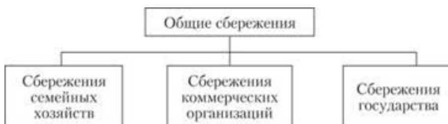
Рис. 2.3. Составные части общих сбережений на макроуровне

Общая величина сбережений еще не означает, что все они могут превратиться в инвестиционные ресурсы. Для того чтобы значительная их часть превратилась в инвестиции, необходимы определенные условия, которые должно создавать государство.