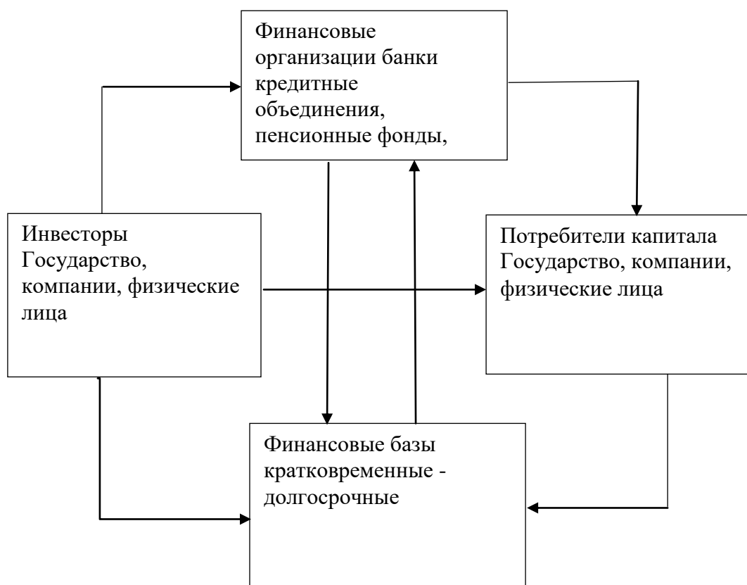
Рис . 1.2 Инвестиционный процесс ( Мехтиев И.А “Инвестиционная структура Азербайджана и ее влияние на развитие экономики”)

Прибыльность – является важным критерием который определяет приоритетность инвестиций. Негосударственные источники инвестиций направляются прежде всего в высокорентабельные отрасли с быстрой оборачиваемостью капитала. В таком случае сферы экономики с медленной