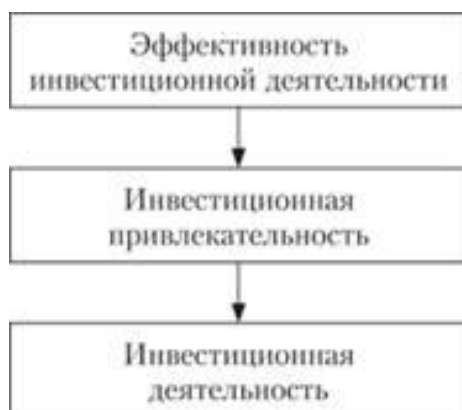
Рис. 2.5. Взаимосвязь инвестиционной деятельности с инвестиционной привлекательностью и эффективностью инвестиционной деятельности

Между этими понятиями существует взаимосвязь, показанная на рис. 2.5.