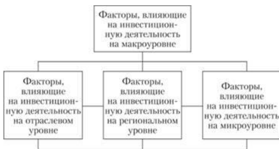
Рис. 2.4. Факторы, влияющие на инвестиционную деятельность и их взаимосвязь

Следует отметить, что все эти факторы тесно взаимосвязаны между собой, но определяющими являются факторы, влияющие на макроуровне (рис. 2.4).