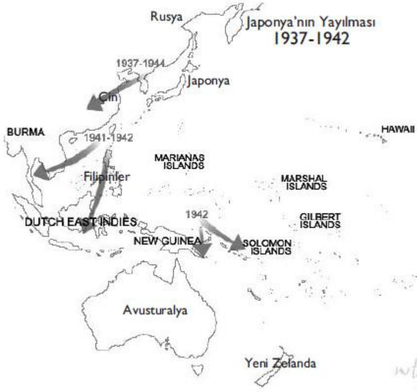
Şekil. 3.1. Harita- Japonya'nın Asyayı İşgali (1937-1942)

Kaynak: http://www.olemiss.edu/courses/pol387/