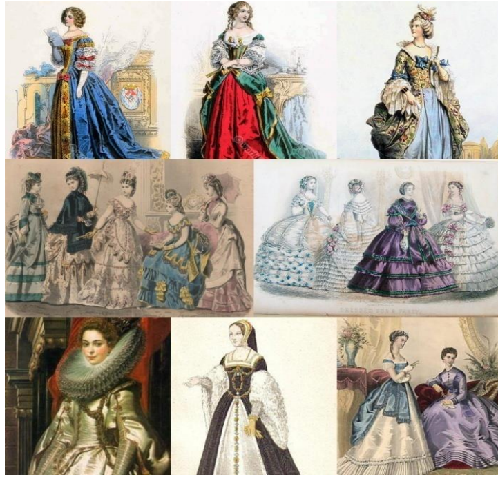
Şekil1. Renessans dövr geyimləri