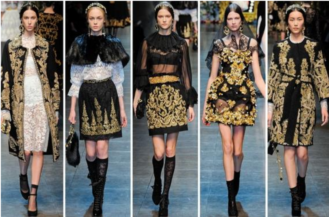
Şekil 2. Dolce & Gabanna- Barokko dövrünə aid 2012 kolleksiyası