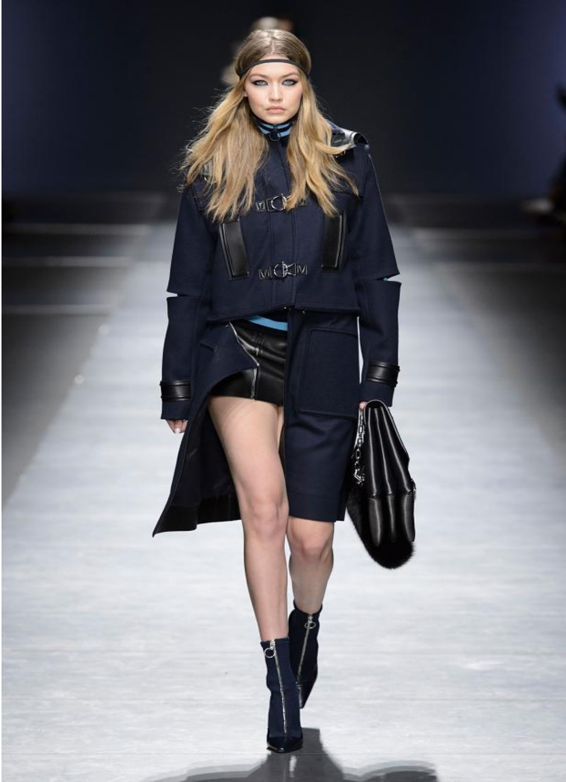
Şekil 4. Donatella Versaçe, 2016 qış geyim kolleksiyası