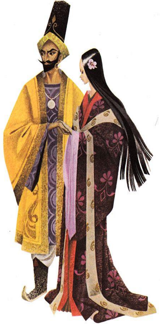
Şekil 9. Folklor üslub nümunesi