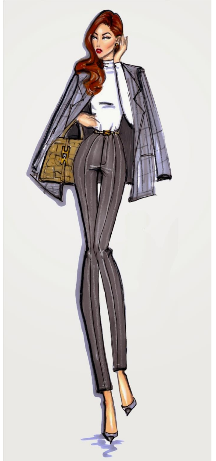
Şəkil 8. Klassik üslub nümunələri