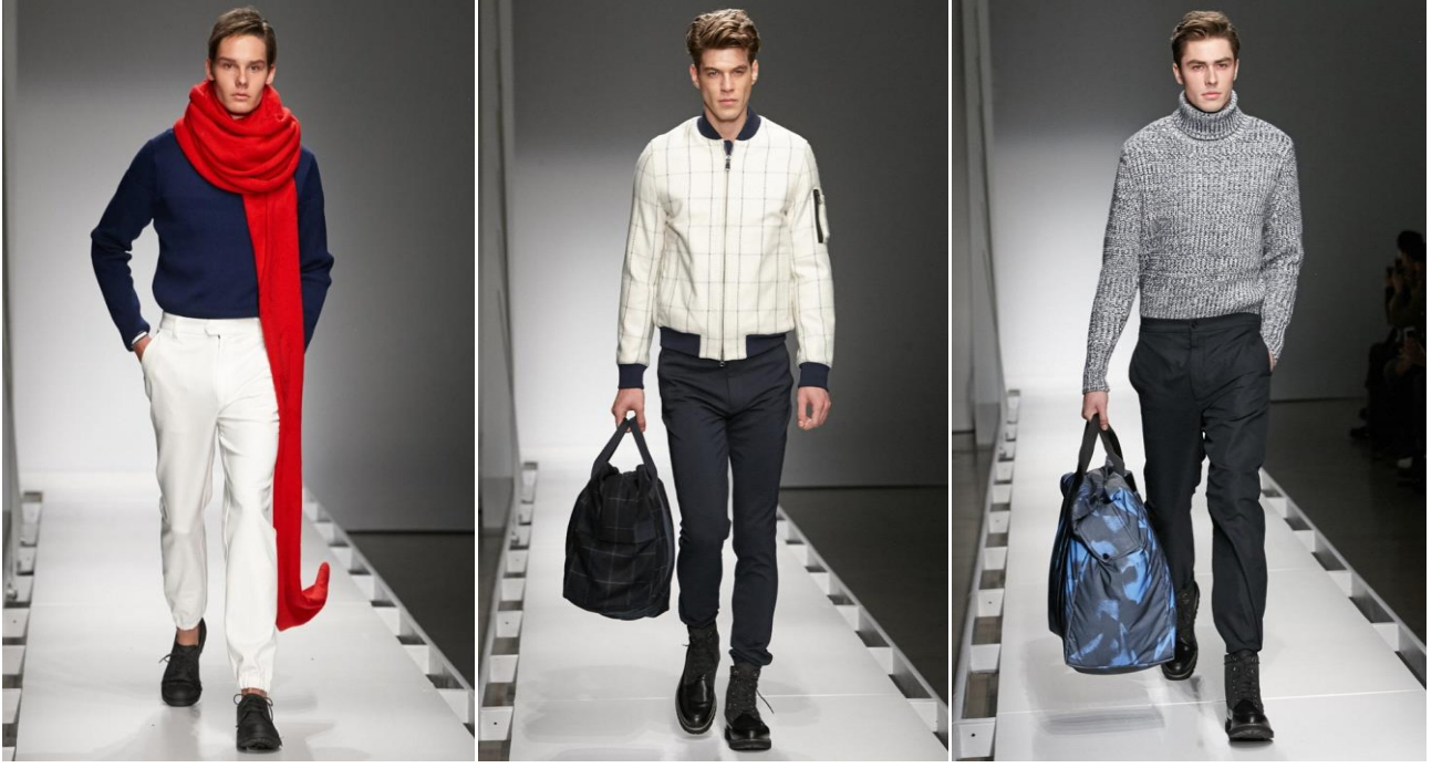
Şekil 5. Nautica, 2016/7 payız-qış kişi kolleksiyası