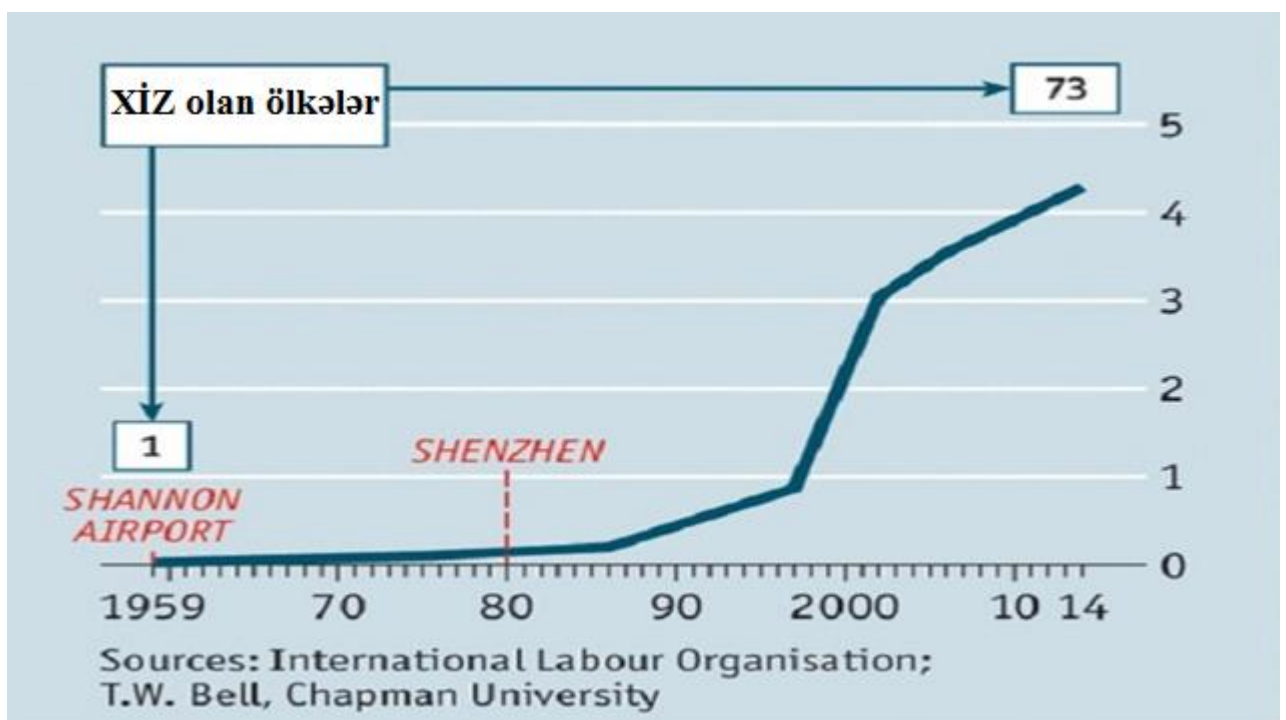
Dünyada Xüsusi İqtisadi zonaların sayı [24] (minlərlə)

Developerlər hindistan ştatlarından biri olan Maxaraştrada öncədən məlum olmayan siyasi kursa, qeyri-şəffaf yoxlama metodlarına və iqtisadi rentabelliliyə inamsızlığa görə qeydiyyatdan keçmiş xüsusi zonalara investisiya qoymaqdan imtina etmişlər. Digər tərəfdən, yerli əhali tərəfindən kütləvi protestlər də potensial investorların XİZ üçün ayrılmış torpaqlara marağını kəskin azalda bilər.