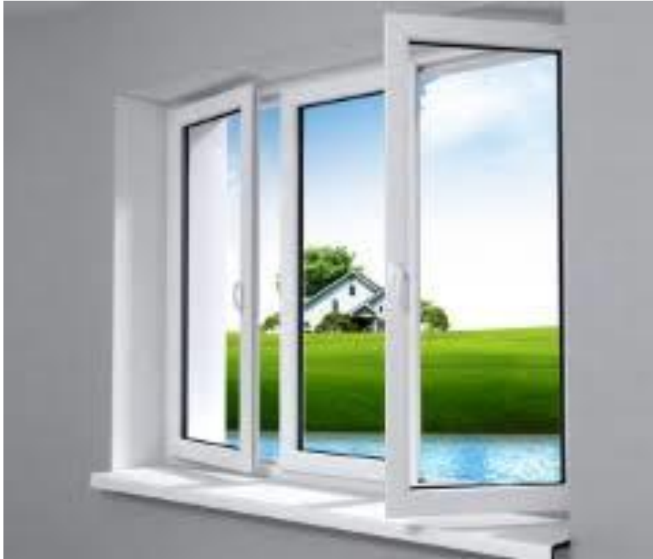
Şəkil 8 .[16]

Inşaat şüşə lifləri - əridilmiş inşaat şüşədən müxtəlif üsullarla hayırlanan süni liflərə deyilir. Kiçik diametrə malik olmasına görə bu liflər yüksək möhkəmliyə və elastikliyə malik olurlar.