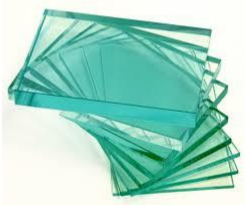
Sadə qalın inşaət şüşəsi