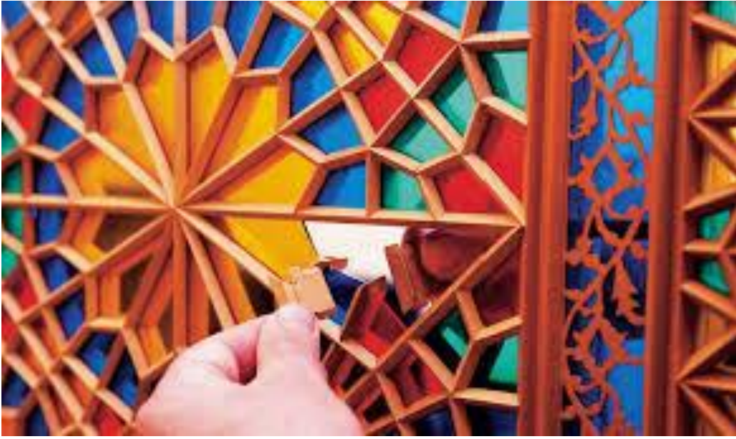
Şəbəkə inşaat şüşəsi

Mollir inşaat şüşələr. Mollirləşdirmə təbəqə inşaat şüşənin yüksək temperaturda öy kütləsinin təsiri altında əyilmə prosesidir. Preslənmiş inşaat şüşələrdən fərqli olaraq mollirləşdirilmiş inşaat şüşələrdə inşaat şüşə təbəqənin yalnız bir səthi forma və ya çərçivənin konturuna toxunur.