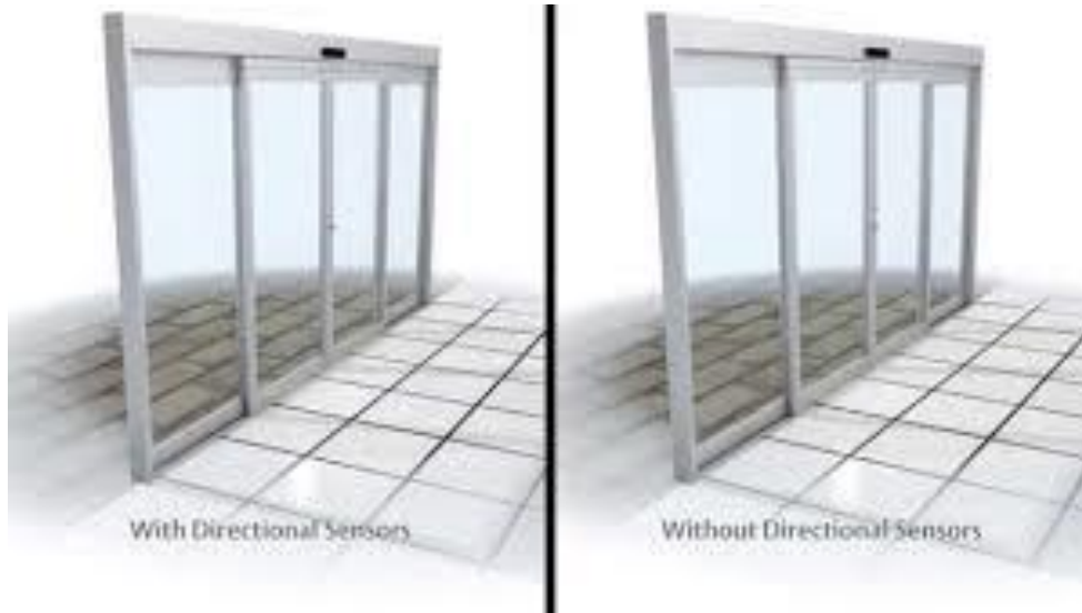
Şəkil 4 .[16]

inşaat şüşələrini də həmçinin deşmək və kəsmək olar. Görünməyən aralıq qat səmərəli şəkildə səsiyolyasiyasını artırır və ultrabənövşəyi şüaların təsirini ayaldır.