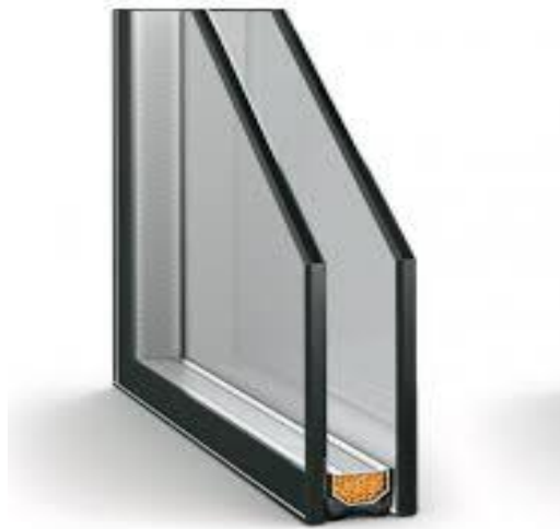
Şəkil 7 .[16]

Smalta – kiçik ölçülü rəngli inşaat şüşələr olub, moyaika işlərində tətbiq edilir. Smalta karlaşdırılmış rəngli inşaat şüşələrdən, qızılı və gümüşü inşaat şüşələrdən ayrılır. Karlaşdırılmış smaltın əsas xüsusiyyəti onun müxtəlif rəngə boyanmasıdır, onların rəssamlıq işini xatırladan kəsikli səthi xüsusi faktura yaradır.