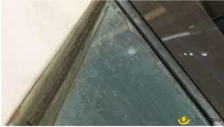
Şəkil 6 .[16]

Smalta – kiçik ölçülü rəngli inşaat şüşələr olub, moyaika işlərində tətbiq edilir. Smalta karlaşdırılmış rəngli inşaat şüşələrdən, qızılı və gümüşü inşaat şüşələrdən ayrılır. Karlaşdırılmış smaltın əsas xüsusiyyəti onun müxtəlif rəngə boyanmasıdır, onların rəssamlıq işini xatırladan kəsikli səthi xüsusi faktura yaradır.