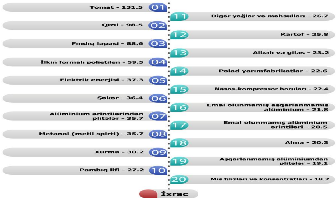
2017-ci ilin 10 ayında ixrac olunan əsas qeyri-neft mallarının siyahısı (Dəyəri milyon ABŞ dolları ilə)

2017-ci il müddətində eksport edilən qeyri-neft sahəsi məhsulları içərisində pomidor (tomat) birinci olaraq qeyd edilib (151.6 milyon ABŞ dolları). Mövcud siyahıda ikinci mövqeni qızıl (125.4 milyon ABŞ dolları), üçüncü mövqeni isə qabığı təmizlənmiş meşə fıındığı (114.5 milyon ABŞ dolları) tutub.