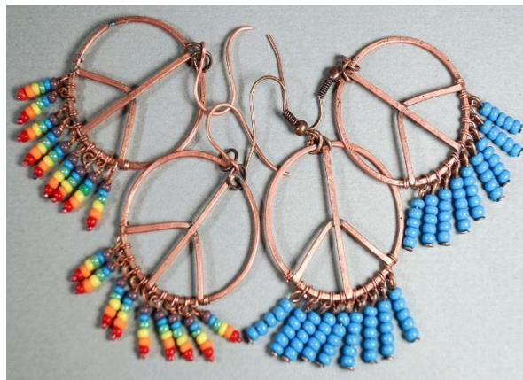
Şəkil 3. Hippilərin istifadə etdikləri aksesuarlar.