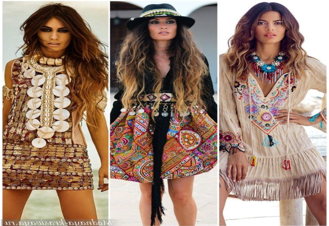
Şəkil 5. Müasir moda sferasında hippie üslubunda olan geyimlər