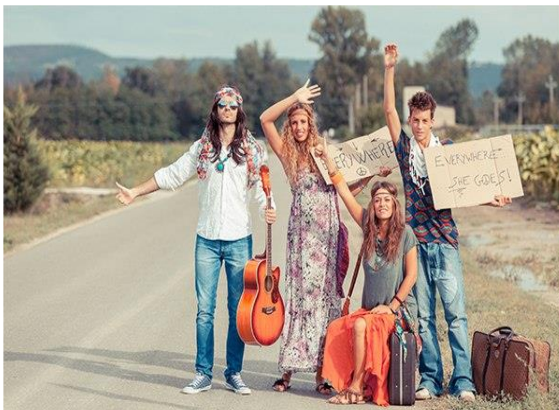
Şəkil 2. Hippilərin al-əlvan mikroavtobusu, 50-60-cı illərin hippiləri.