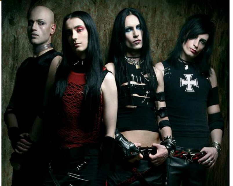
Şəkil 1. Müxtəlif altmədəniyyətlərin nümayəndələri: modlar, skinhedlər, panklar, qotlar.