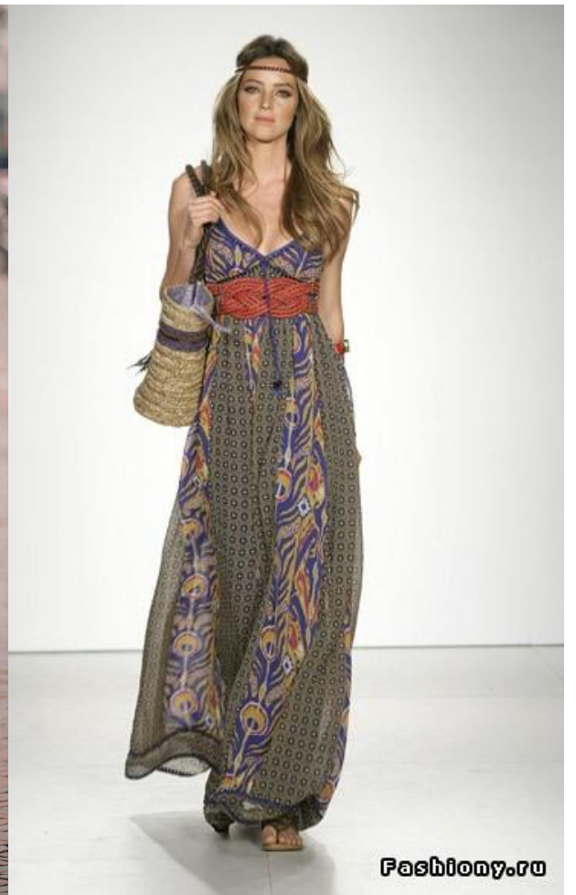
Şəkil 4. Etnik,hippi və boho üslublarının oxşar və fərqli xüsusiyyətləri