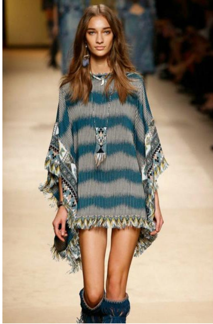
Şekil 3. Milli-ünsürlü müasir geyim