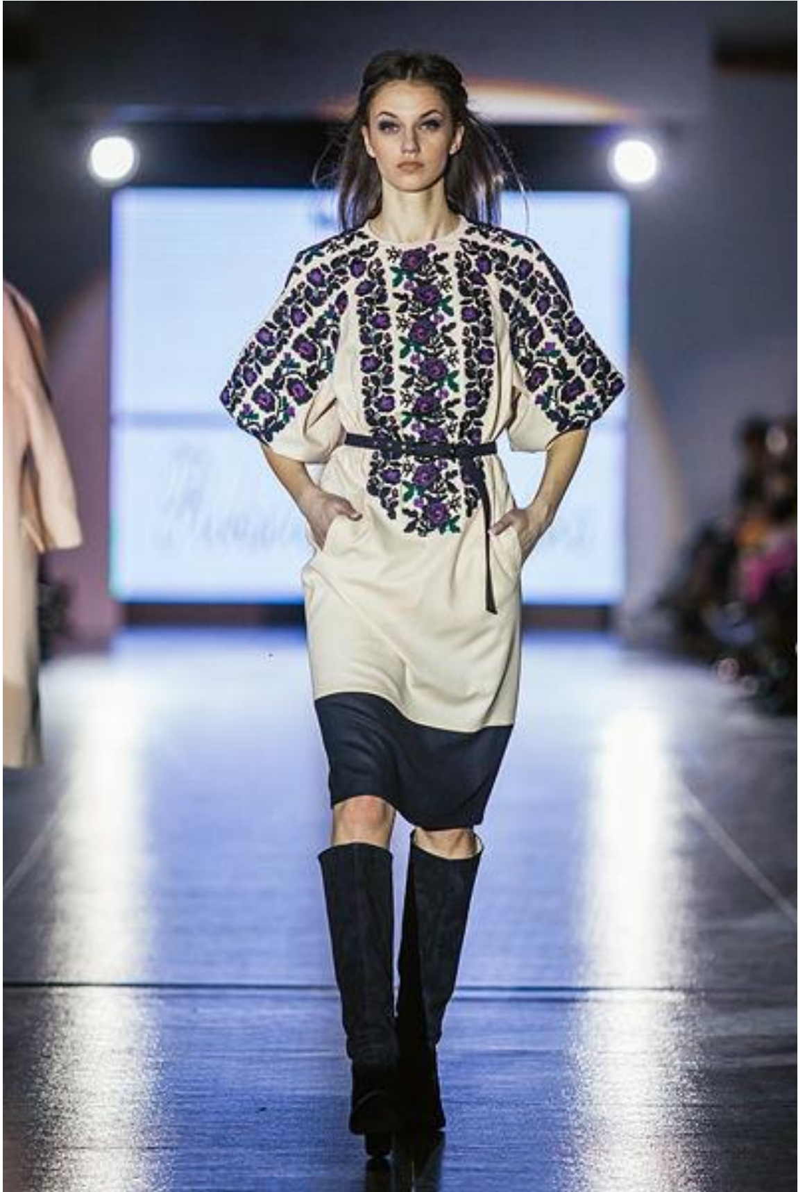
Şəkil 2. Milli element əlavəsilə müasir geyim