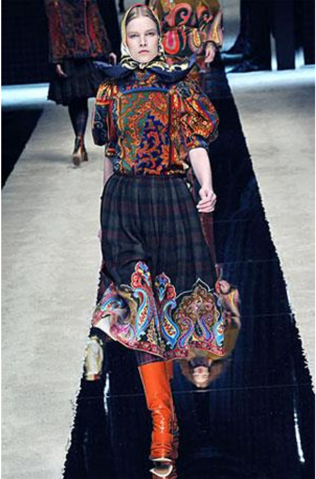
Şekil 4. Etno-elementli müasir geyim