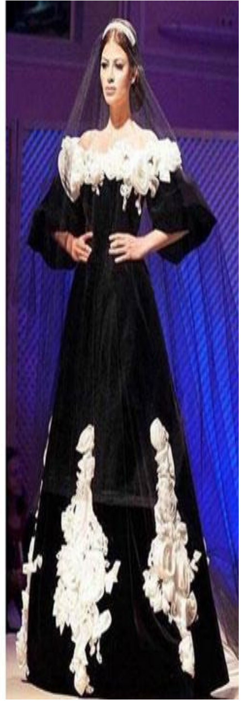
Şekil 6. Etnoünsürlü müasir geyim