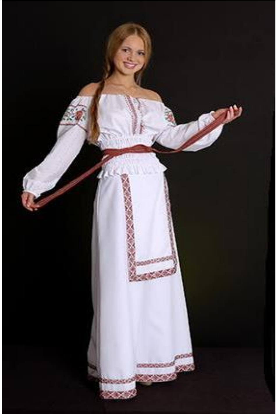
Şekil 5. Etno-elementli müasir geyim