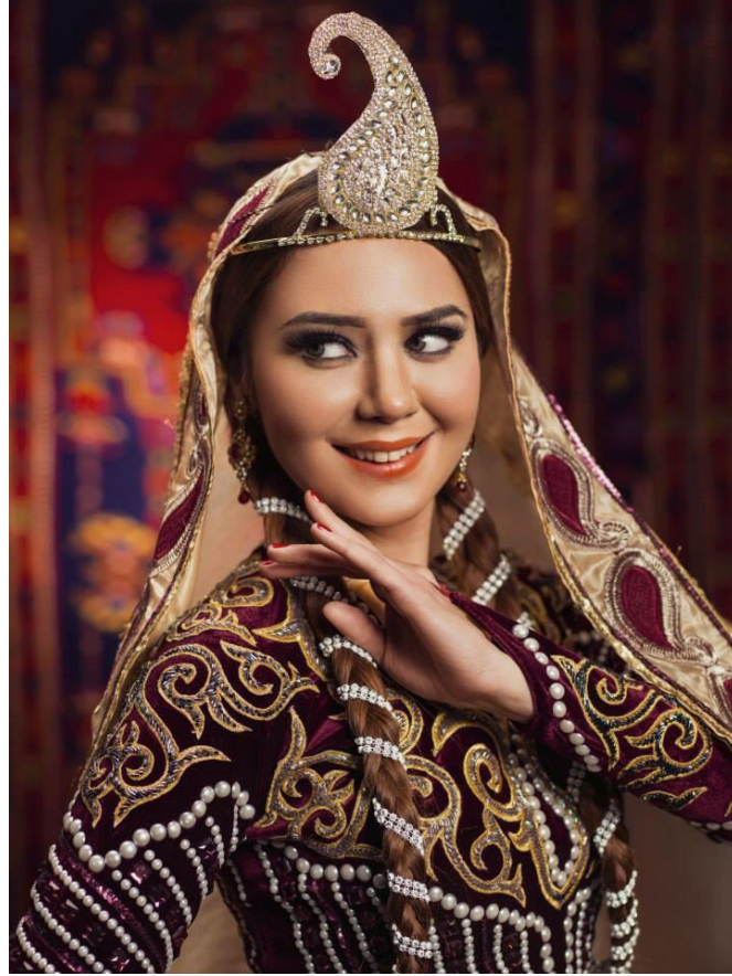
Şekil 1. Etnik ünsürlü müasir geyim