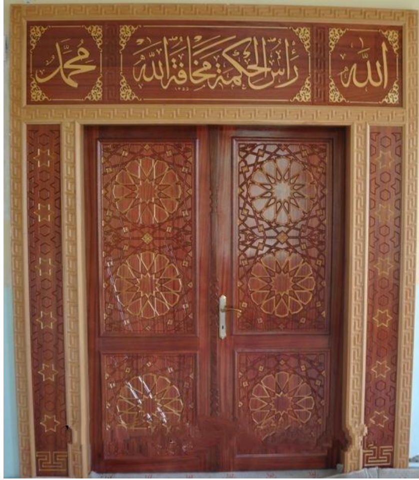
Şəkil 2. Həndəsi naxışlarla işlənmiş məscid qapısı