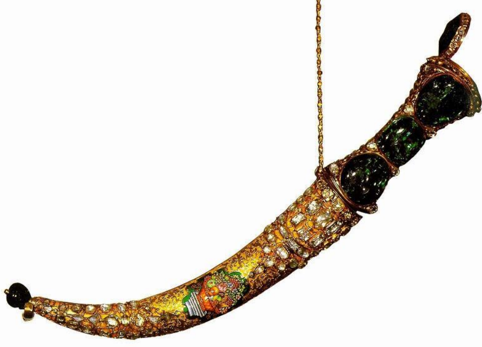
Şəkil 3. Üzəri qiymətli daş-qaşlarla bəzədilmiş silah