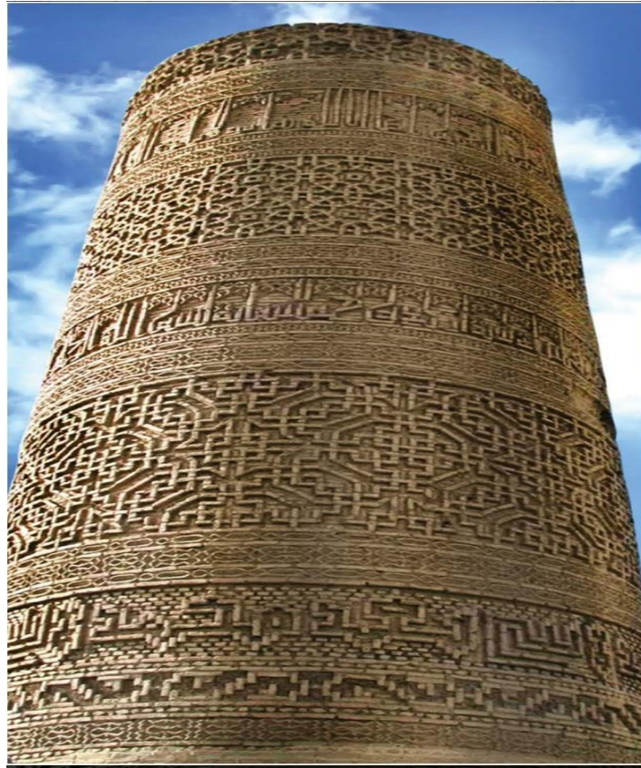
Şəkil 11. “Möminə Xatun” türbəsi. Memar Əcəmi