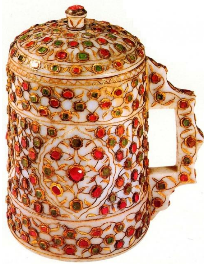
Şəkil 6. Üzəri daş-qaşlarla bəzədilmiş Orta əsr keramika nümunəsi