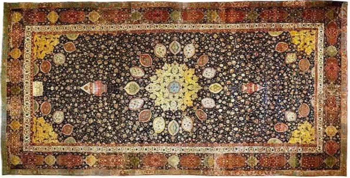
Şəkil 4. Azərbaycan xalçaçılığı. "Şeyx Səfi" xalçası