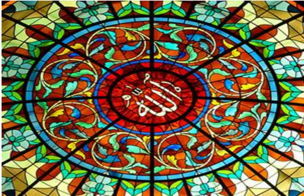
Şəkil 5. İslam şüşə nümunəsi