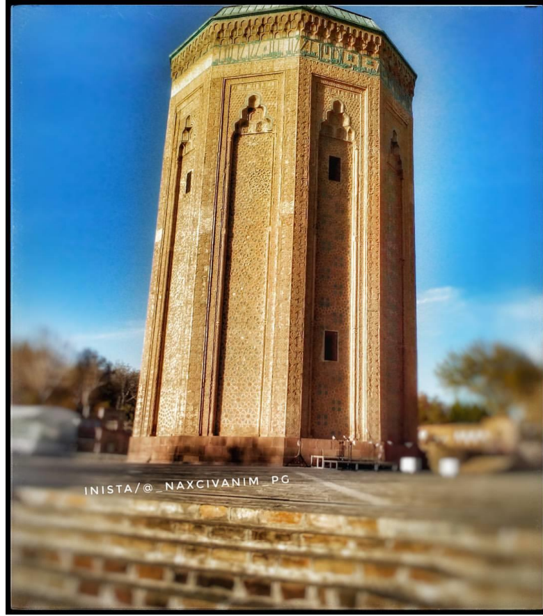
Şəkil 10. Oyma və xəttatlıq sənətin özündə birləşdirən İslam memarlığı