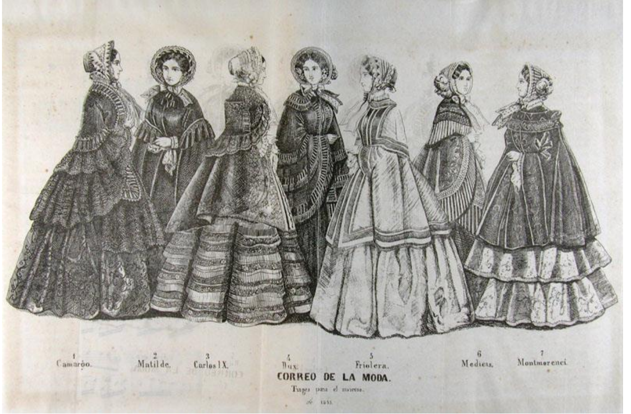
Şəkil 3. İngilis geyim forması XVII-XVIII əsrlər.