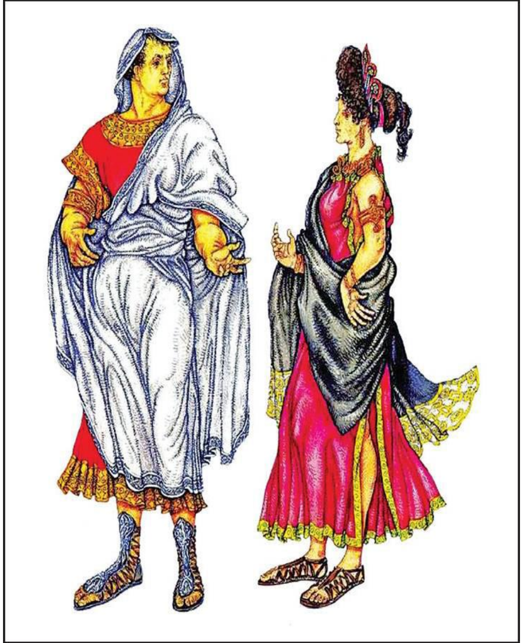
Şəkil 2. Antik geyim forması. III-V əsr