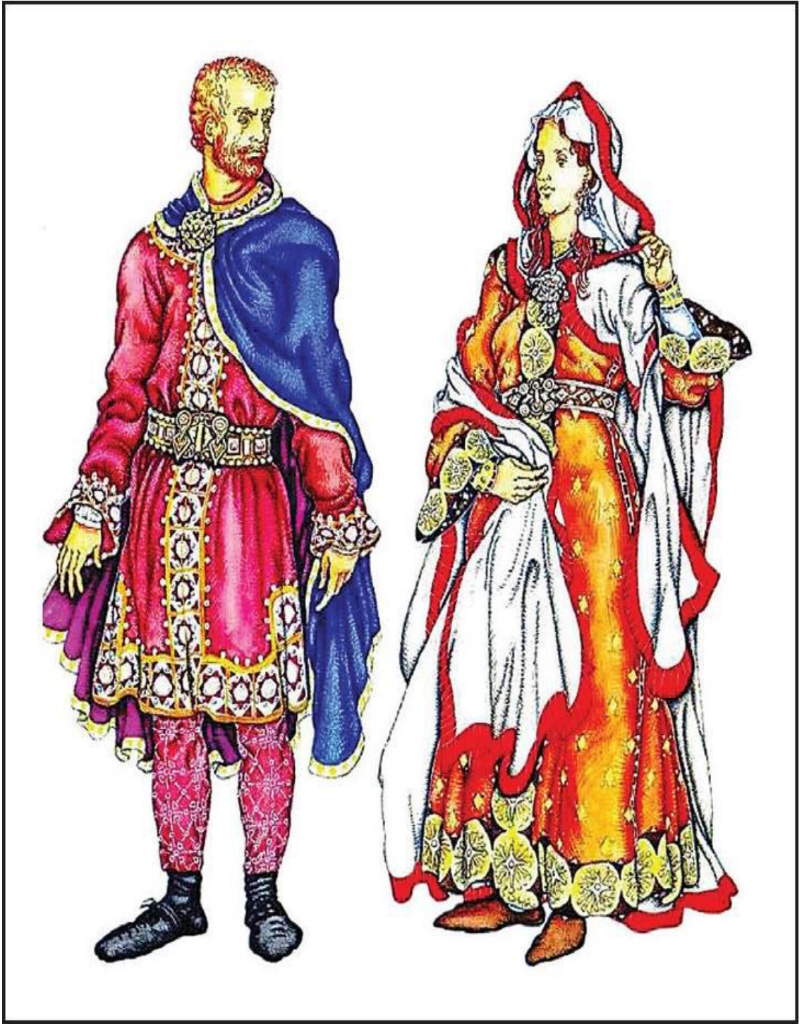
Şəkil 4. Roman geyim forması. X-XII əsr