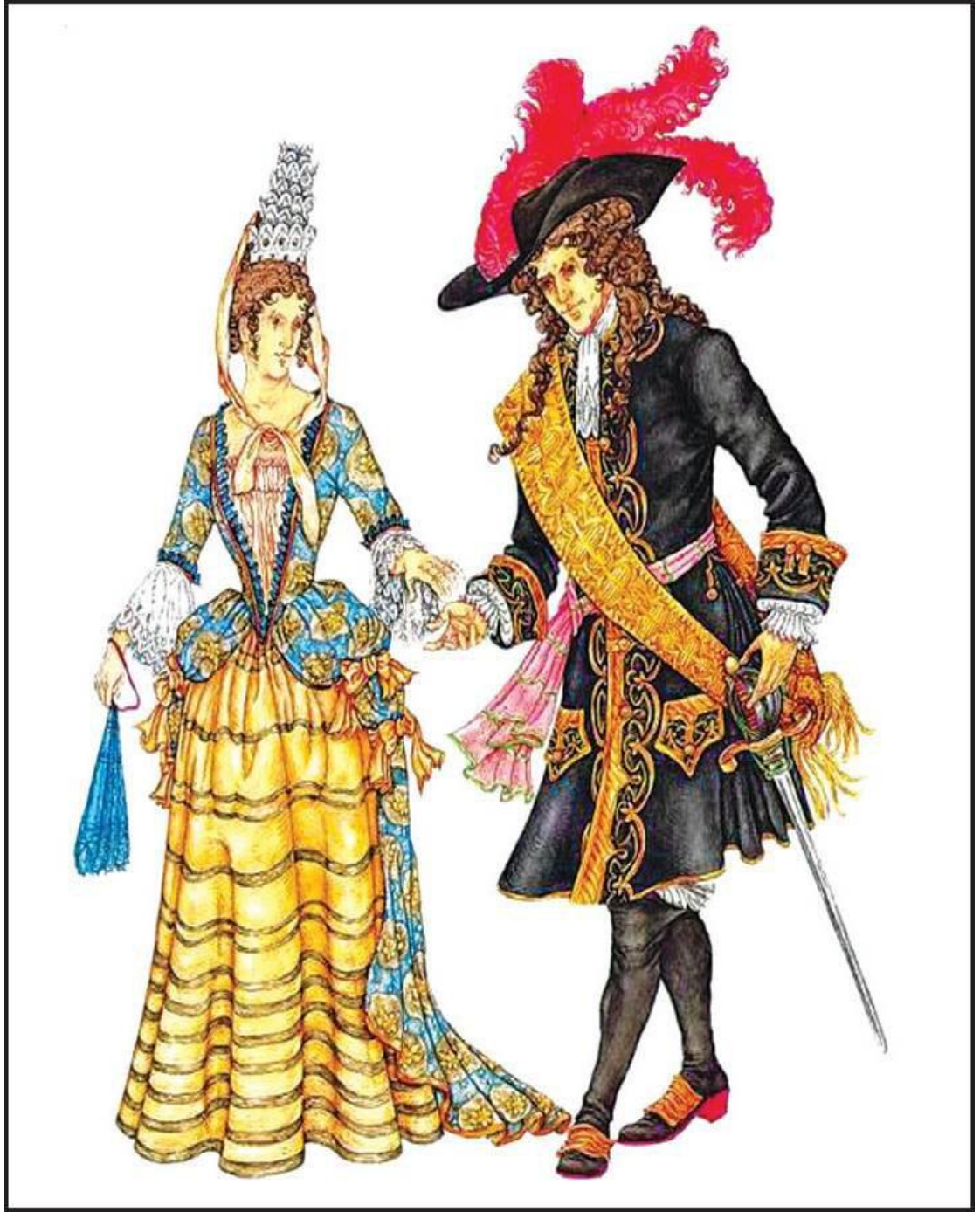
Şəkil 7. Qərbi Avropa rokoko geyimi. XVIII əsr