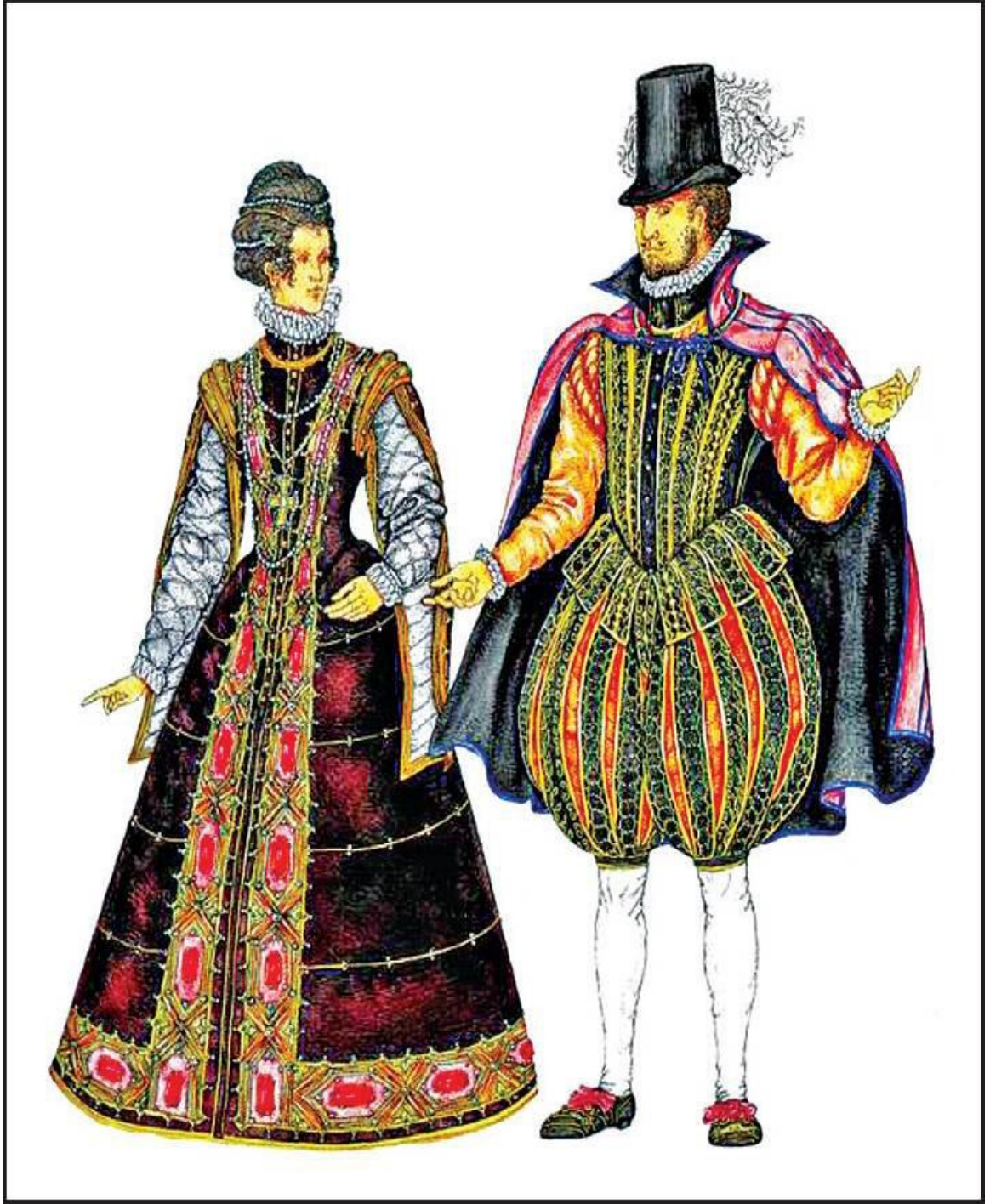
Şekil 5. İspan geyim forması. XV-XVII əsr.