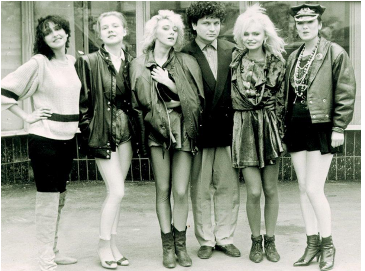
1980-cı illərdə geyim üslubu.