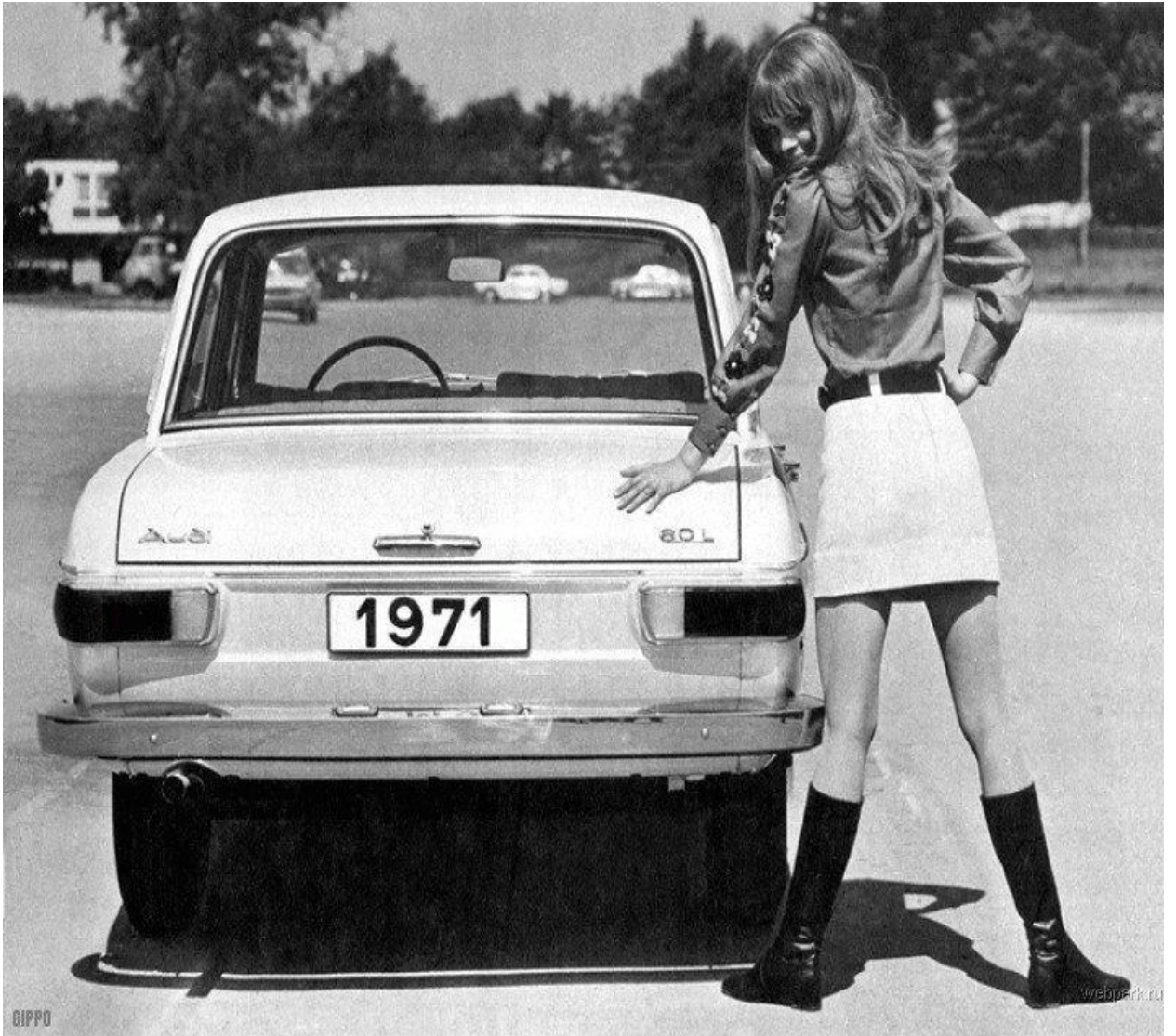
1970-ci illərdə geyim üslubu.