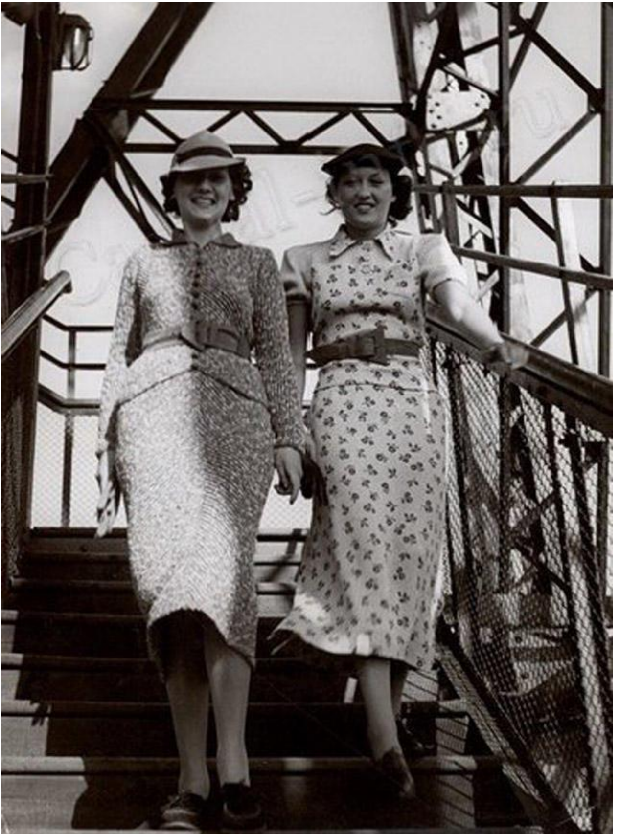
1930-cu illərdə geyim üslubu.