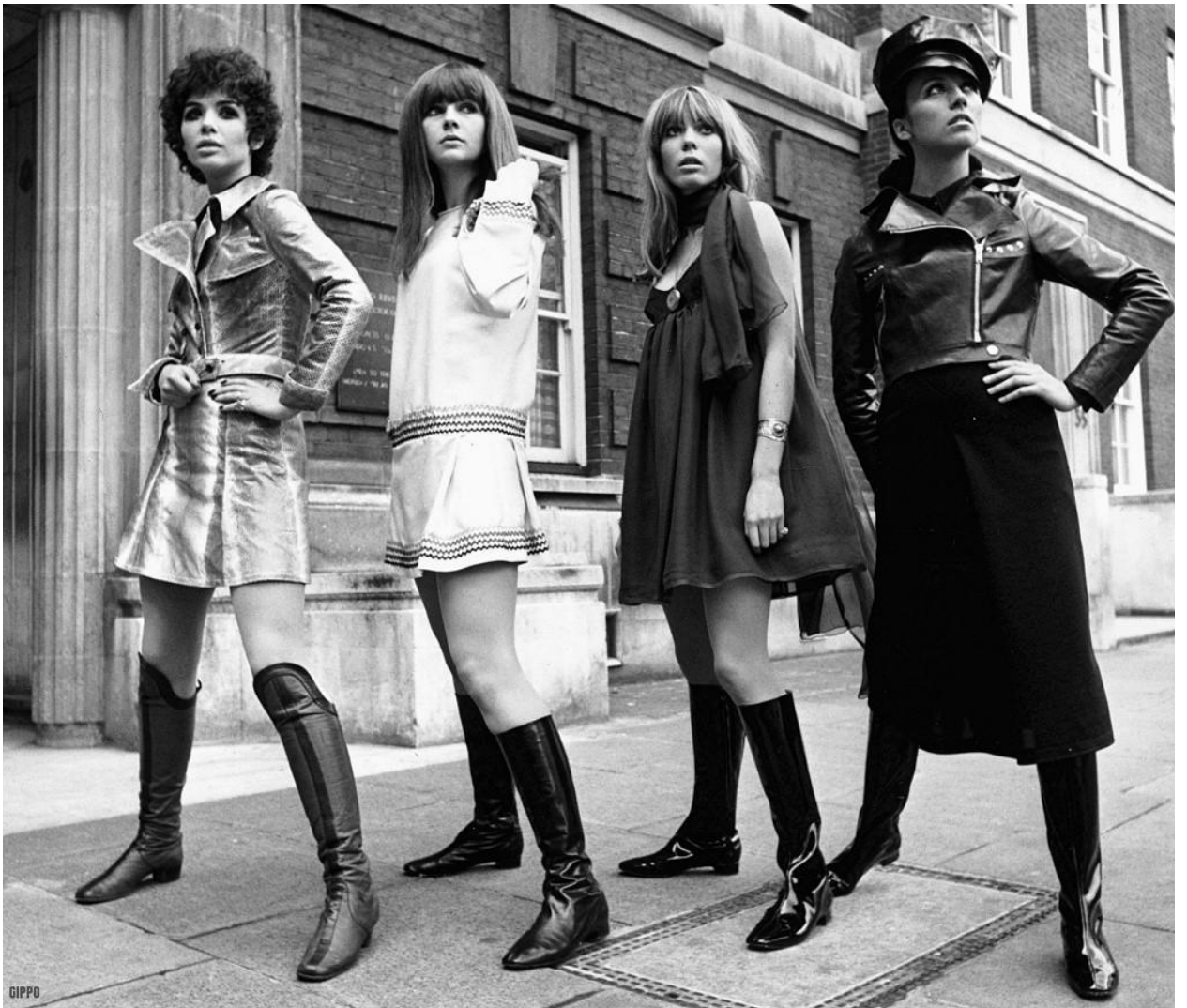
1960-cı illərdə geyim üslubu.