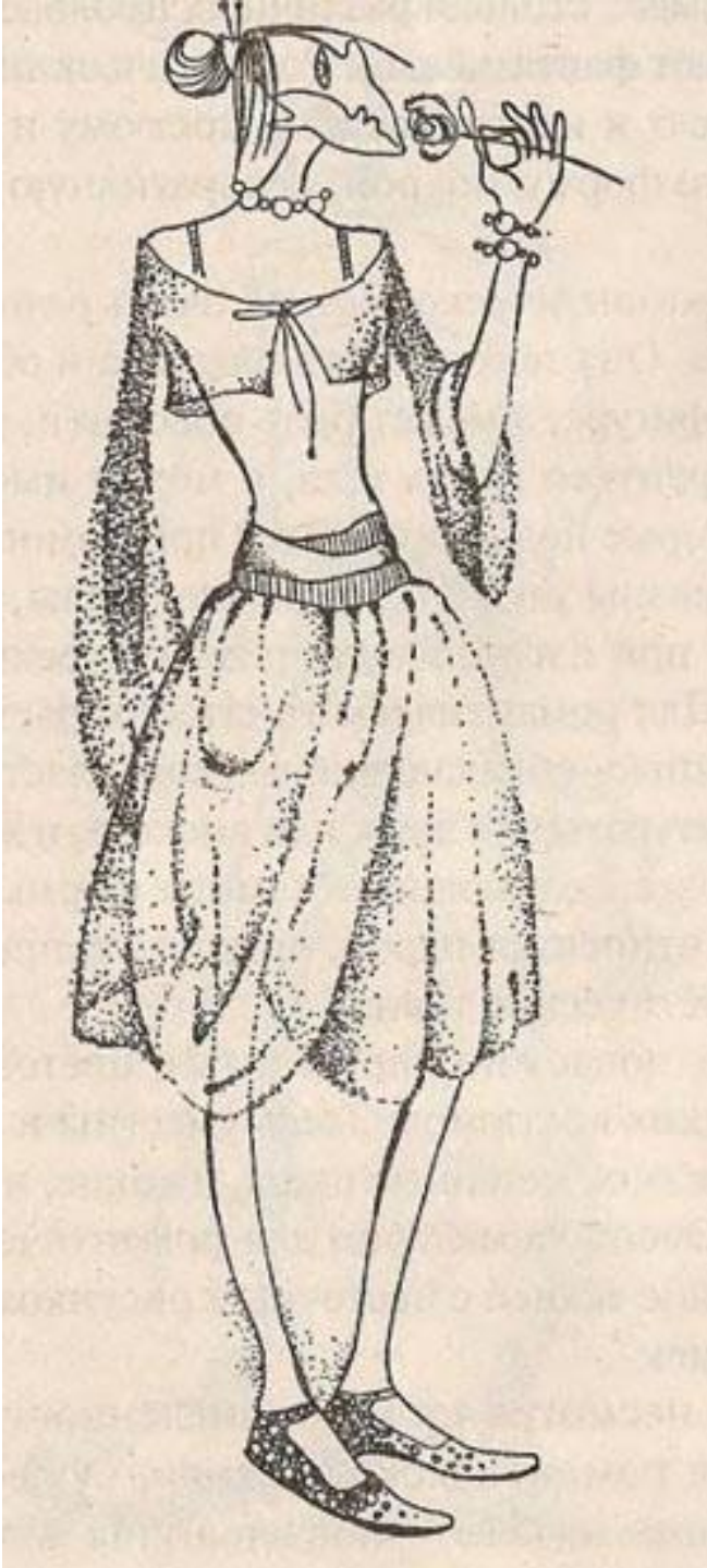
Romantik geyim üslubu.