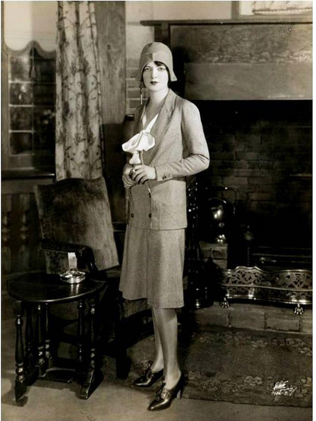
1920-ci illərdə geyim üslubu.