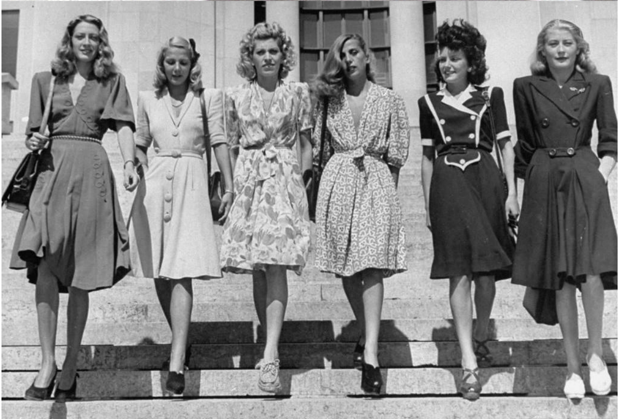
1940-cı illərdə geyim üslubu.