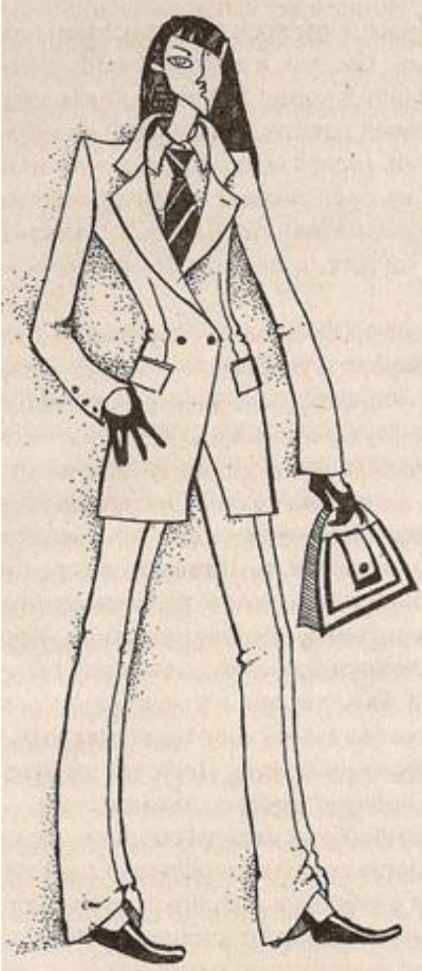
Klassik geyim üslubu.