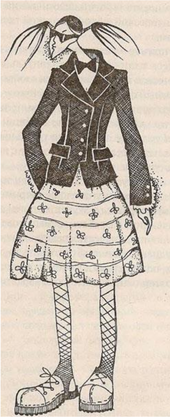
Eklektik geyim üslubu