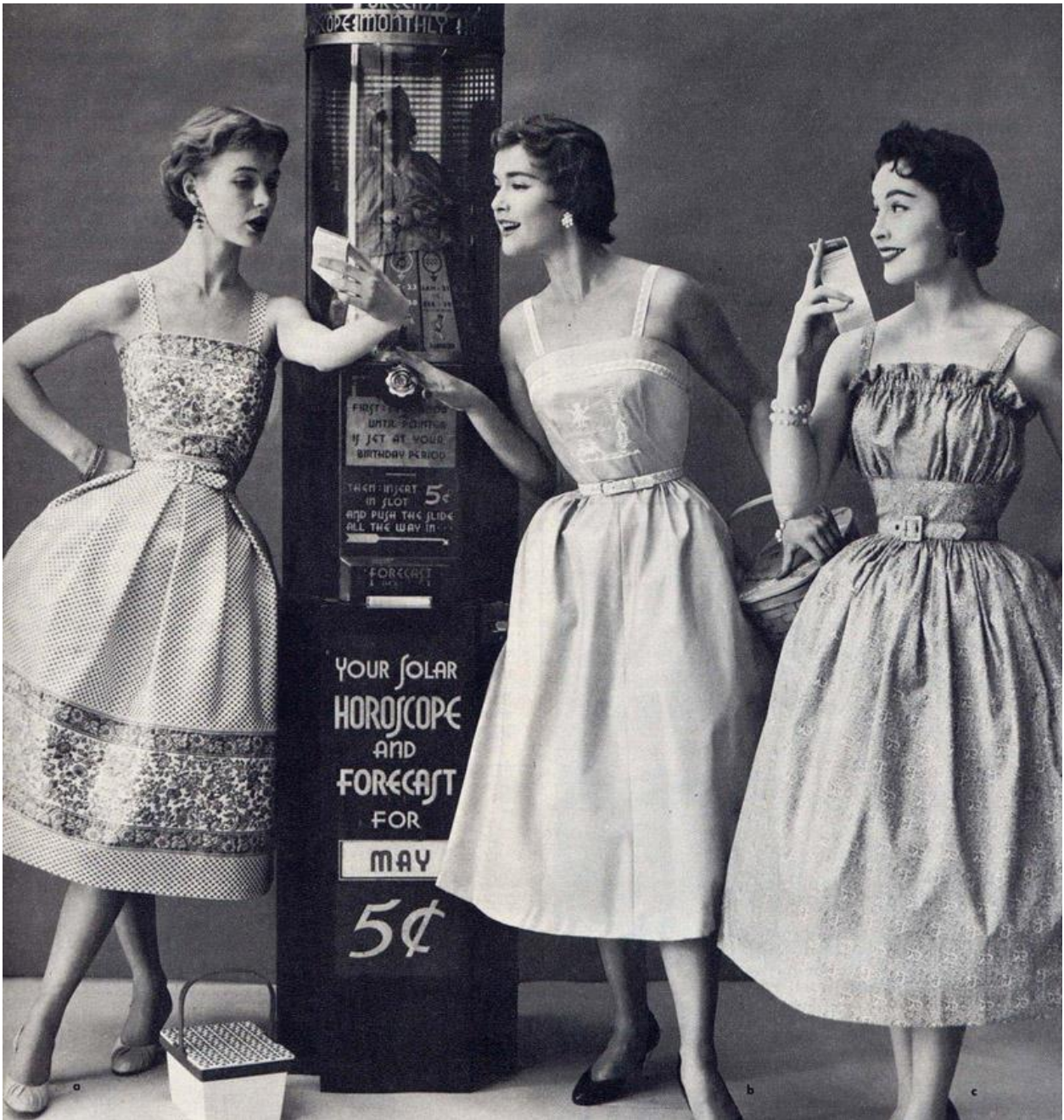
1950-ci illərdə geyim üslubu.