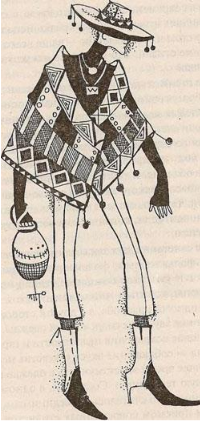
Folklor geyim üslubu.