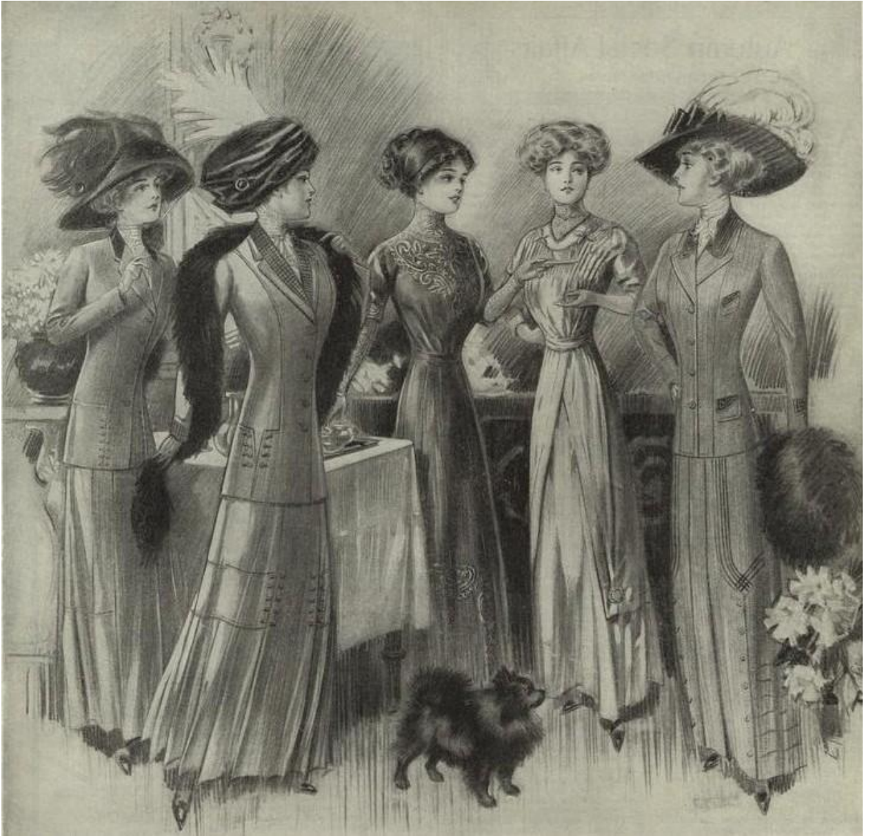
1910-cu illərdə geyim üslubu.