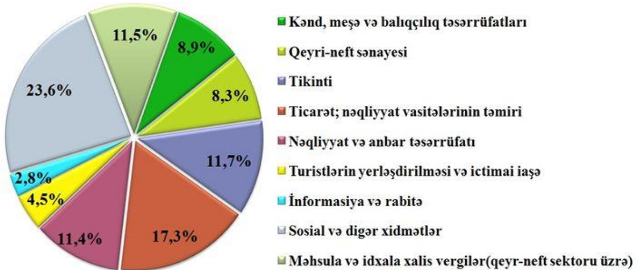
Qrafik 2. Ölkənin qeyri-neft sənayesi üzrə bölgü (2018)