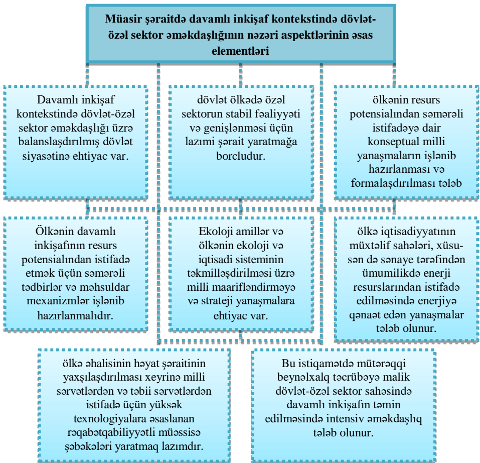
Şəkil 1. Müasir şəraitdə davamlı inkişaf kontekstində dövlət və özəl sektor arasında əməkdaşlığın nəzəri aspektlərinin əsas elementləri (müəllif tərəfindən hazırlanmışdır).

Təbii ki, bu konseptual yanaşmalar dövlət və cəmiyyətin ahəngdar inkişafına, bütövlükdə ölkənin təbii və iqtisadi ehtiyatlarının resurs potensialından səmərəli istifadə etməyə imkan verəcək 2 .