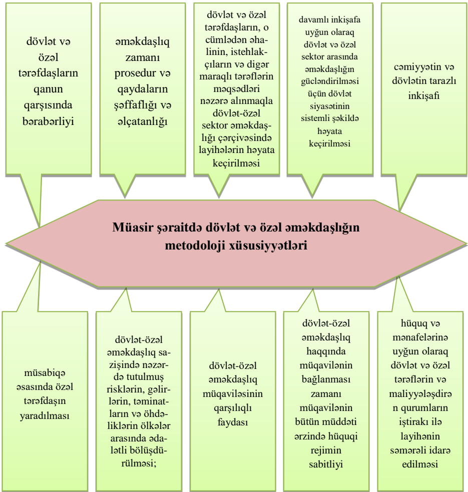
Şəkil 2. Müasir şəraitdə dövlət və özəl əməkdaşlığın ən mühüm metodoloji xüsusiyyətləri

ümumi səmərəliliyinin təmin edilməsi yolu ilə; 5) rəqabətin formalaşması və xidmətlər bazarının inkişafı və s.