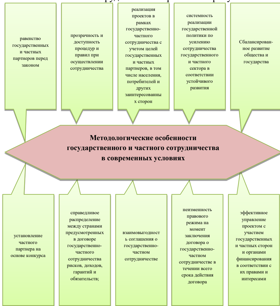
Рисунок 2. Наиболее важные методологические особенности государственного и частного сотрудничества в современных условиях (подготовлено автором на основе исследовательских материалов).

Наиболее важные методологические особенности государственного и частного сотрудничества отражены на рисунке 2.