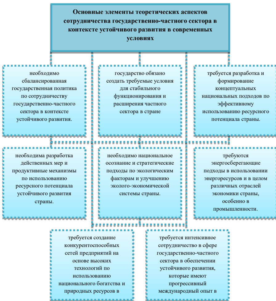
Рисунок 1. Основные элементы теоретических аспектов сотрудничества государственного и частного секторов в контексте устойчивого развития в современных условиях (подготовлено автором).

Здесь рассматриваются важнейшие аспекты развития национальной экономики и на основе концепции устойчивого развития справедливо рассмотреть 3 важнейшие направления: 1) обеспечение устойчивого экономического развития; 2) охрана и восстановление экосистемы, обеспечение социальной справедливости во всем обществе. Безусловно, эти концептуальные подходы позволят гармонично развиваться государству и обществу,