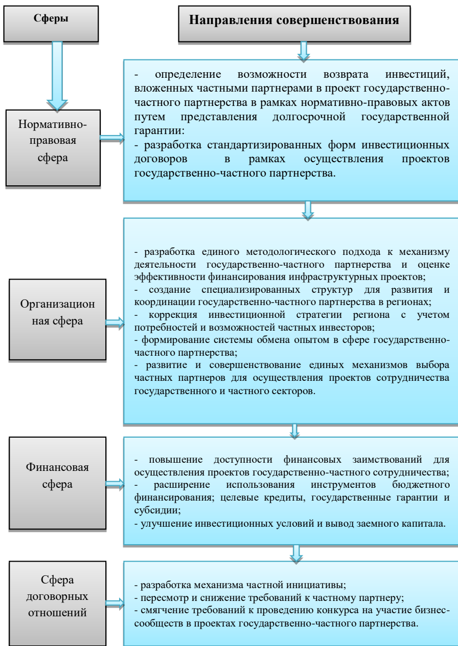
Рисунок 3. Направления совершенствования государственно-частного партнерства (составлен автором).