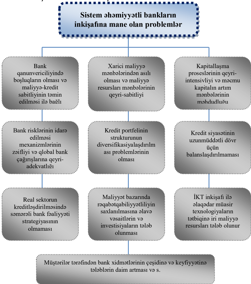
Şəkil 1. Sistem əhəmiyyətli bankların inkişafına mane olan problemlərin təxmini sxemi.

xidmətləri bazarının inkişafı ilə əlaqələri olan qlobal problemlər nəzərə alınmaqla, sistem əhəmiyyətli bankların inkişafına mane olan problemlər şəkil 1-də verilmişdir.