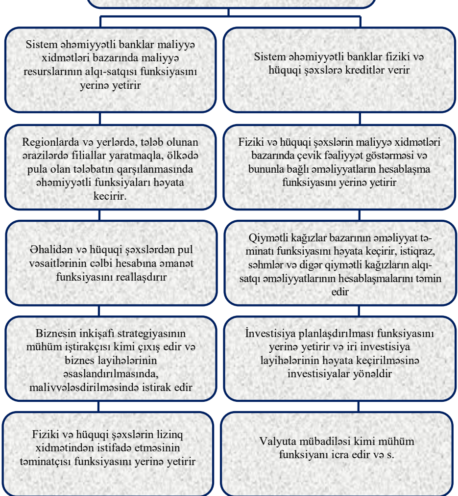
Şəkil 5. Yeni çağırışlar şəraitində maliyyə xidmətləri bazarında sistem əhəmiyyətli bankların strateji funksiyaları və onların xüsusiyyətlərinin