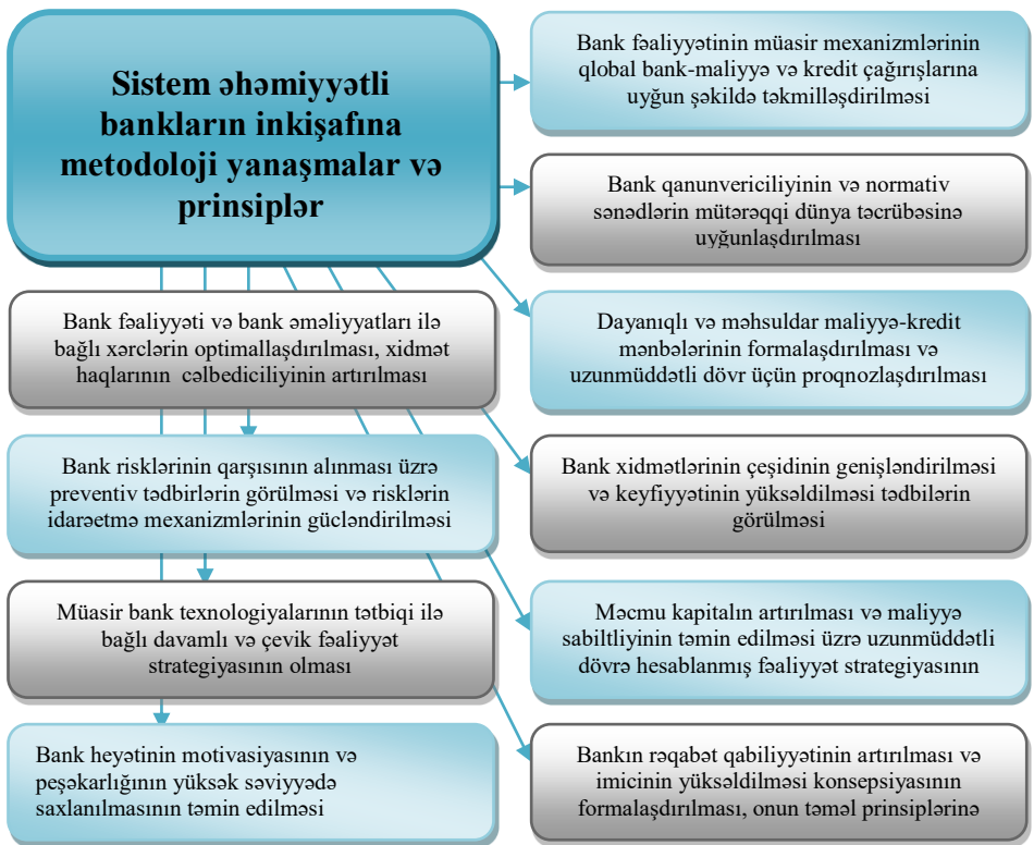
Şəkil 2. Sistem əhəmiyyətli bankların inkişafına metodoloji yanaşmalar və prinsiplərin blok-sxemi (müəllif tərəfindən hazırlanmışdır).

Qeyd edək ki, maliyyə xidmətləri bazarının genişləndirilməsi və inkişaf etdirilməsi, bu bazarın fəaliyyət mexanizmlərinin səmərəliliyini aşağı salan problemlərin aradan qaldırılması, sistem əhəmiyyətli bankların daha geniş çeşiddə və çevik xidmətlərlə bu bazarda təmsil olunması, bazarın dinamikliyi mühüm əhəmiyyət kəsb edir 6 . Bu prinsiplərin və meyarların sistem əhəmiyyətli bankların fəaliyyətində nəzərə alınması həmin bankların dayanıqlılığın gücləndirilməsində, eyni zamanda həmin bankların daha geniş çeşiddə