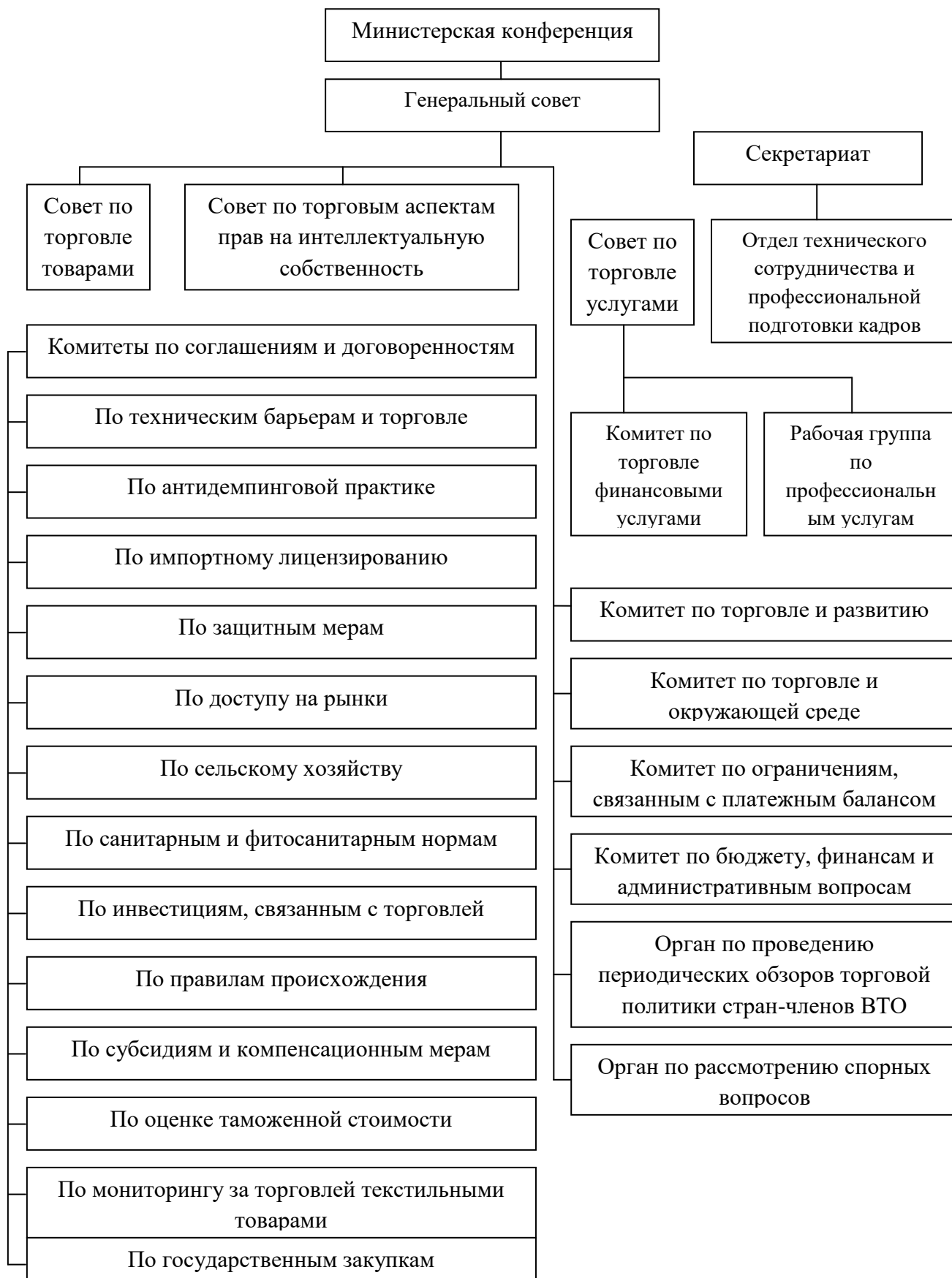
Рис.1.1. Организационная структура ВТО (28, с.22)