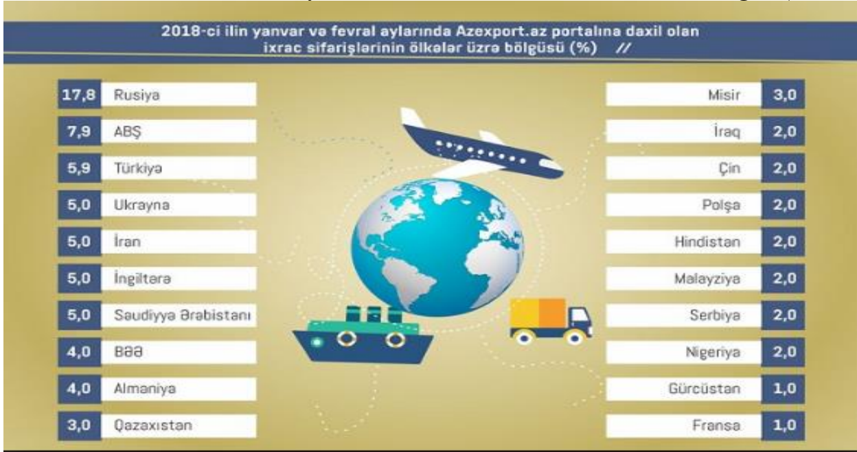
Şəkil 3. 2018-ci ildə Azərbaycana olan ixrac sifarişlərinin ölkələr üzrə bölgüsü(%-lə)

Əksinə, təzə tərəvəz ixracı 1,5 faiz, meyvə və tərəvəz şirələri – 15,2 faiz, şəkər 44,7 faiz, tütün 20,1 faiz, marqarin, qida üçün yararlı digər qarışıqlar 7,8 faiz, çay 17,6 faiz, qara metallardan yarımfabrikatlar 70,9 faiz, bentonit gili 3,2 faiz azalıb. 2018-ci ilin yanvar –fevral aylarında ölkəyə ixrac sifarişləri artıb və bunların içərisində dünyanın böyük ölkələri xüsusi yer tutur və bunu aşağıdakı şəkildə ölkələr üzrə faiz dərəcələri ilə müqayisəli şəkildə görə bilərik.