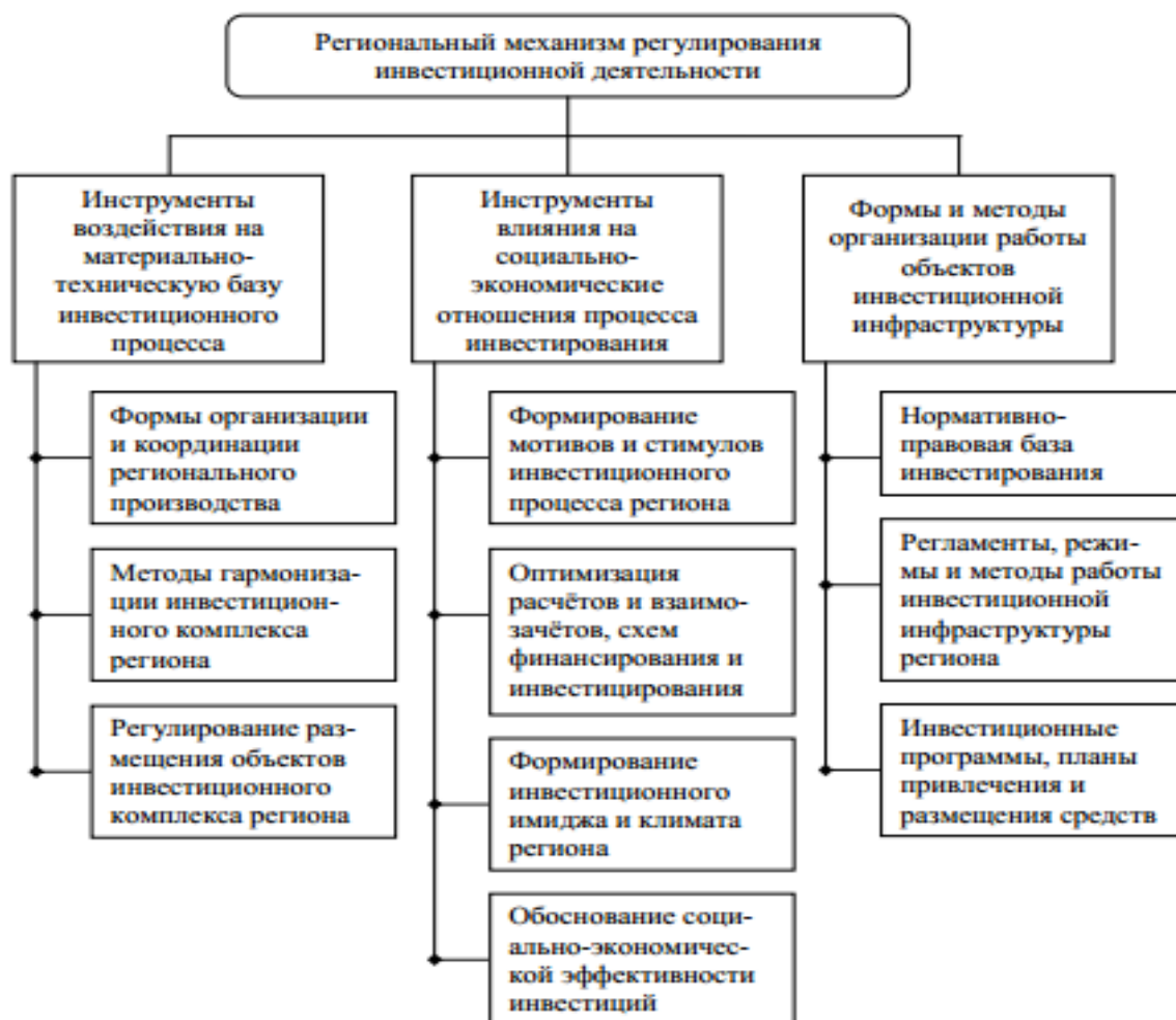
Рисунок 1: Механизм регионального регулирования инвестиционной деятельности