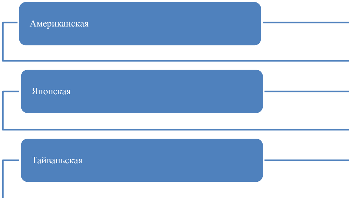
Рисунок 4: Модели инструментов в инвестициях