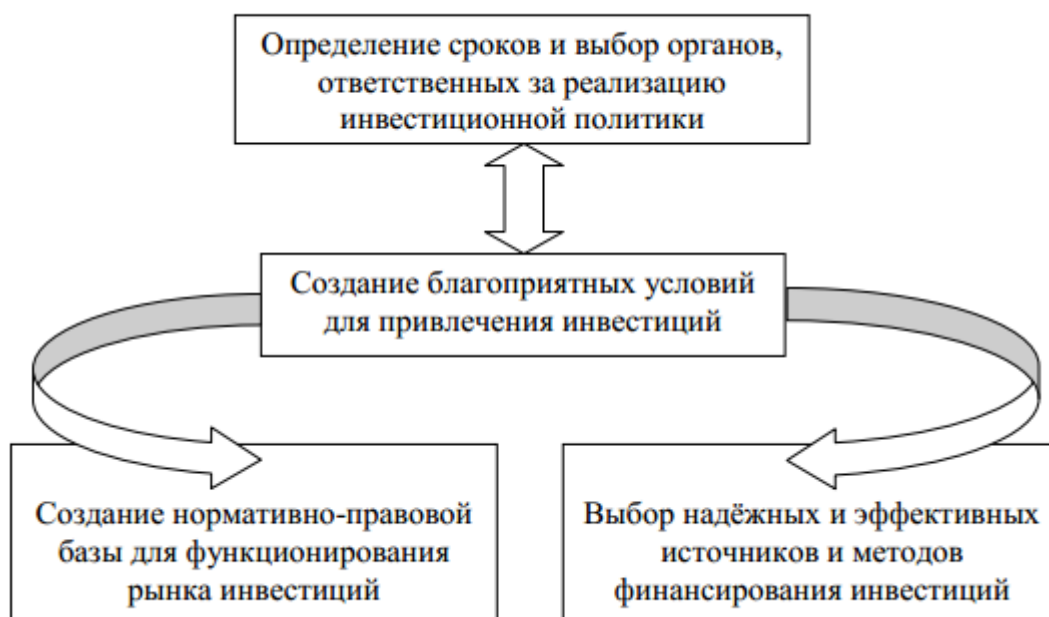
Рисунок 2: Механизм реализации инвестиционной политики