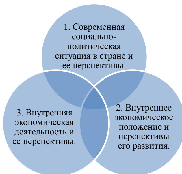
Рисунок 3: Основные составляющие инвестиционного климата

Когда мы говорим об инвестиционном климате (иногда называемом климатом предпринимательства), мы имеем в виду ситуацию, которая существует в стране для инвестиционной деятельности. Этот климат состоит из большого количества элементов и может быть сгруппирован в группу.