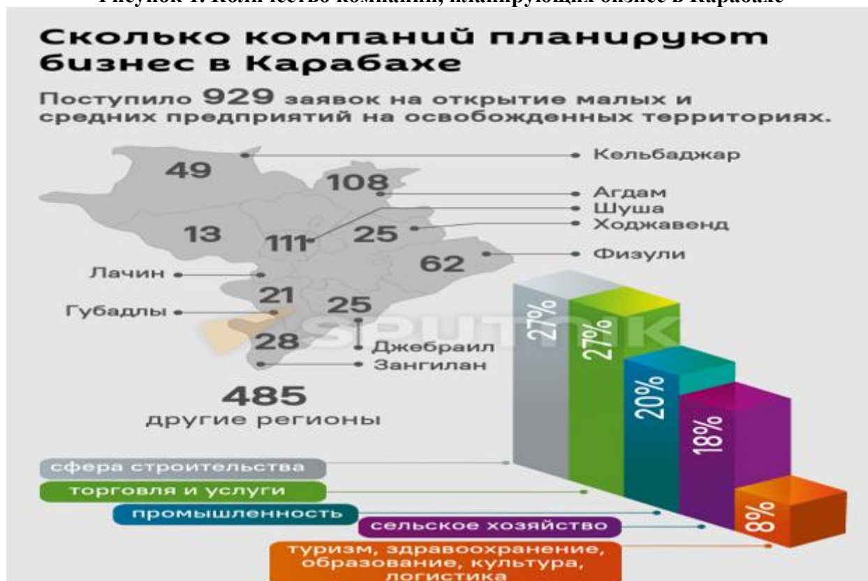
Рисунок 1. Количество компаний, планирующих бизнес в Карабахе