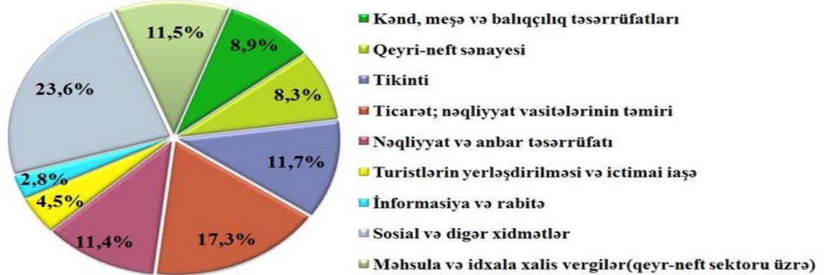
Qrafik 2: Qeyri-neft sektorunda yaradılmış əlavə dəyərin sahələr üzrə bölgüsü