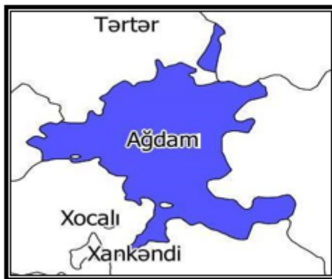
Şəkil 1: Ağdam Rayonu

Yaranma tarixi - 08.08.1930 Əhalinin sayı - 205,1 min nəfər (1 yanvar 2021-ci il) Əhalinin sıxlığı - 1 km 2 178 nəfər (1 yanvar 2021-ci il) Ağdam rayonu ilə Bakı arasında olan məsafə - 362 km