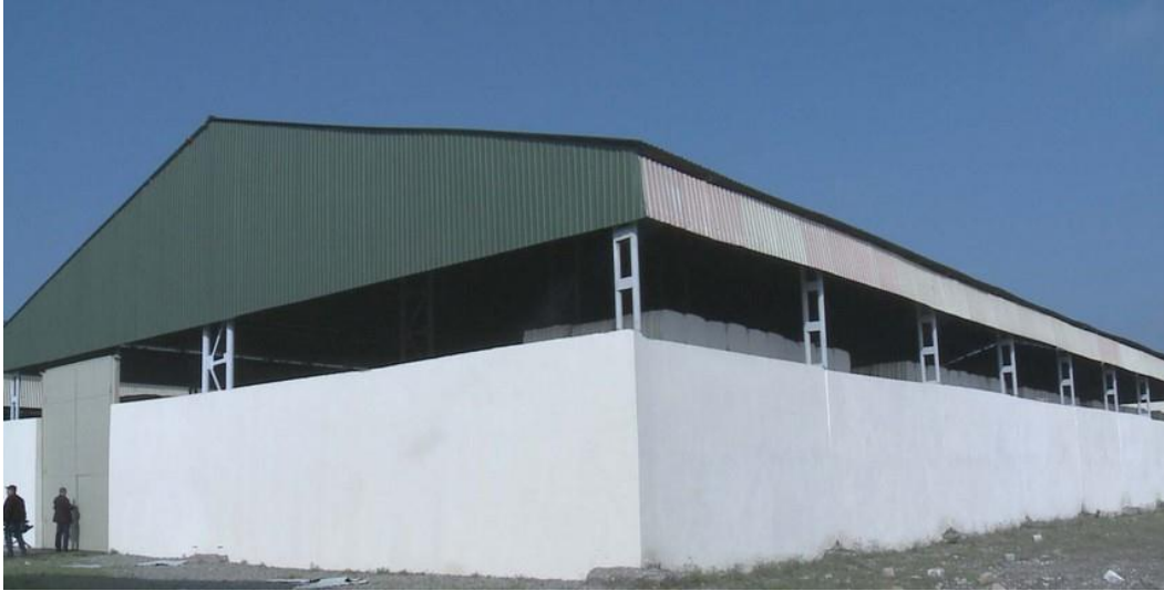
Şəkil 2: Dağıdılan Tərtər pambıq emalı zavodunun bərpa işlərindən sonrakı görüntüsü.