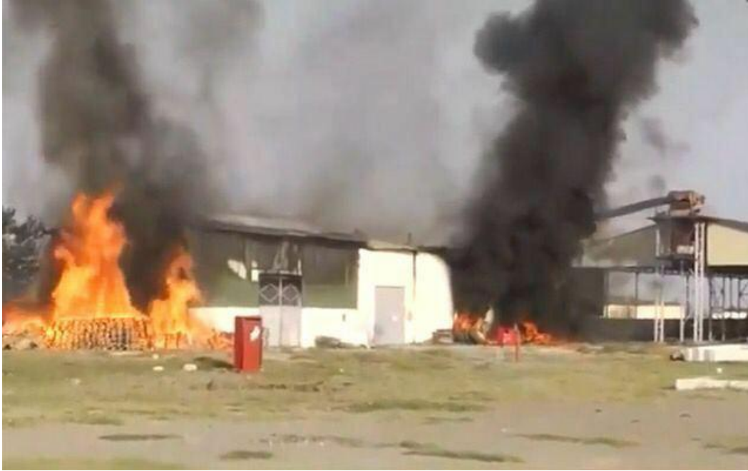
Şəkil 1: Ermənistanın silahlı qüvvələrinin atdığı top mərmisi nəticəsində Tərtər pambıq emalı zavodunun 19.10.2020-ci il tarixli görüntüsü.

Mənbə: https://genprosecutor.gov.az/az/post/3064 (giriş tarixi 25.04.2022)